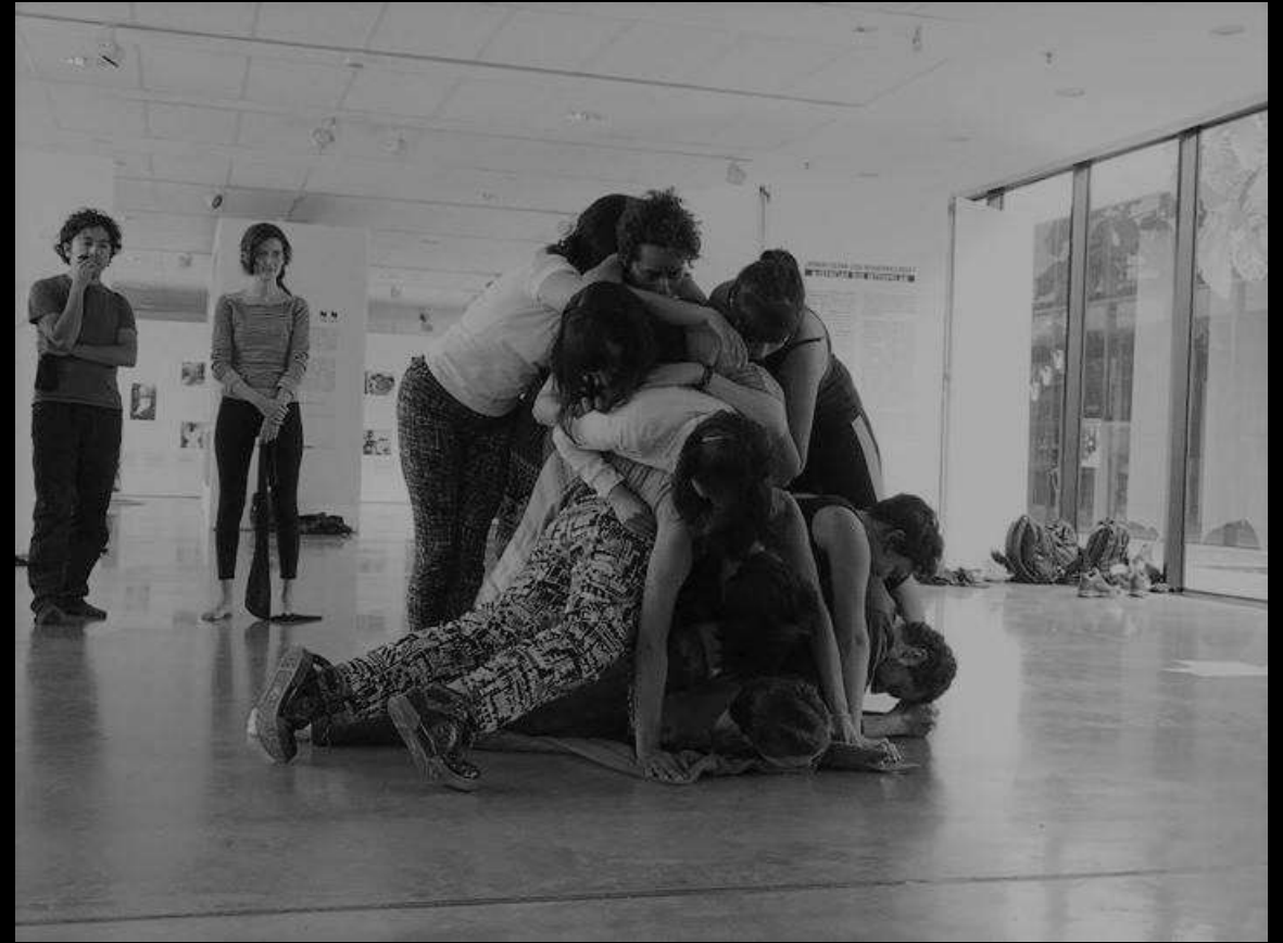
Laboratorio "Arqueología del Cuerpo" - Diplomado "Hacer Algo" -Universidad Tadeo Lozano- Centro Memoria, Paz y Reconciliación, Bogotá, 2015