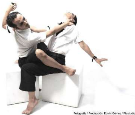
Fotografía / Producción: Edwin Gómez / Riostudio